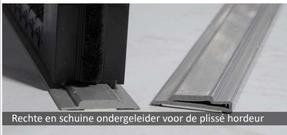
Rechte en schuine ondergeleider voor de plissé hordeur

De pakketbreedte van een gesloten cassette is, bij plisséhordeuren van 960 breed, tussen 8 en 8,5 centimeter, exclusief borstel. Bij de 1300 en de 1600 uitvoering is dit tussen 10 en 12 centimeter en bij de 1900 is dit 14 centimeter. De XL uitvoering heeft een pakketbreedte van 15 centimeter. Bij de 1600 en 1900 uitvoering blijft, in gesloten toestand, een gedeelte van het gaaspakket zichtbaar, circa 1,5 tot 2 cm. De hoogte van de bovenrail bedraagt 6 cm.