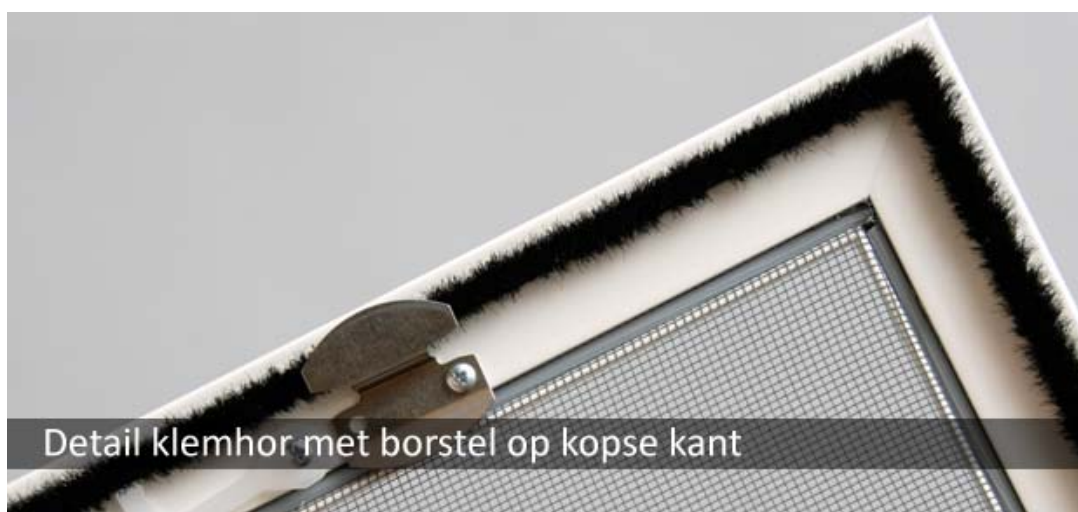
Detail klemhor met borstel op kopse kant

Rabobank 34.55.04.437 BTW nr. NL8196.07.435.B01 KvK nr. 05025489